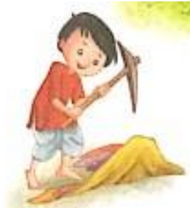
श्रम (shram) Hardwork