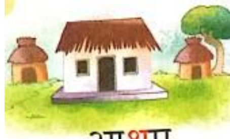
आश्रम (aashram) Hermitage