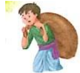
श्रमिक (shramik) Labour